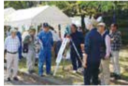
測量体験とバステル画