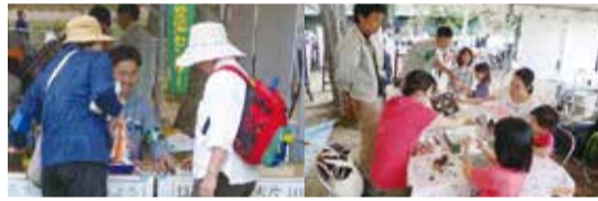
森林にまつわる研究体験