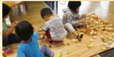
木と遊ぶキッズコーナー

主催:水都おおさか森林づくり・木づかい実行委員会 協賛:一般財団法人日本森林業振興会大阪支部/一般社団法人全国燃料協会 後援:国土交通省近畿地方整備局/近畿地方環境事務所/近畿農政局/三重県/滋賀県/京都府/奈良県/和歌山県/大阪市/大阪市教育委員会/滋賀県森林組合連合会/京都府森林組合連合会/奈良県森林組合連合会/兵庫県森林組合連合会/和歌山県森林組合連合会/滋賀県木材協会/一般社団法人京都府木材組合連合会/奈良県木材協同組合連合会/兵庫県木材協同組合連合会/和歌山県木材協同組合連合会/内閣府公益社団法人大阪府親友会/公益社団法人国土緑化推進機構/公益財団法人関西・大阪21世紀協会/公益財団法人国際花と緑の博覧会記念協会/帝国ホテル大阪/産経新聞大阪本社/森林環境の保全・整備連絡調整会議