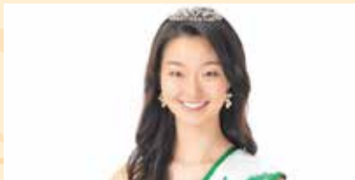
「ミス日本 みどりの女神」来場