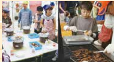
森の食材を活かしたフードコーナー