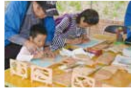
ミニ欄間彫り体験(有料)