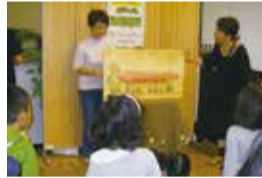
大型絵本の読み聞かせ