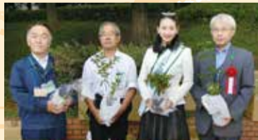
苗木プレゼント (数量限定、スタンプラリー制)