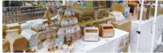
木のおもちゃ、イス、まな板、アクセサリなど木製品の販売