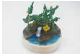
水源の森ジオラマづくり