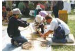
つるかご編み(有料)