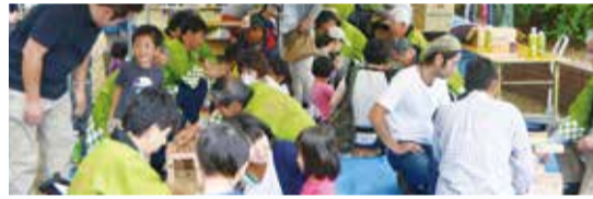
親子木工教室(小学生、イス作り)