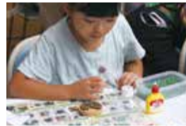
自然素材のクラフト